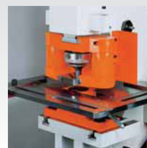
*Estrattore con molla in gomma