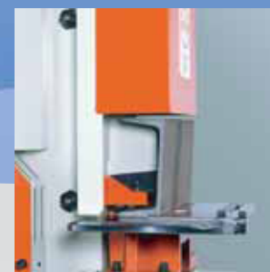
Stozzatura profilati su IW-85KD