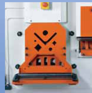
Prelamiera idraulico (opzionale su IW-45K)