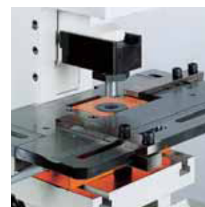
*Gruppo Punzonatrice Su Stozza.